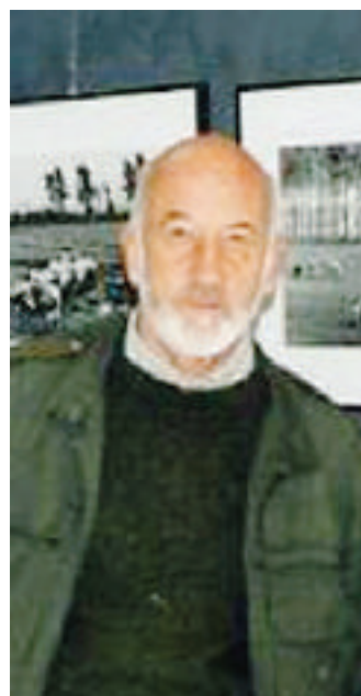
Gianni Berengo Gardin

Il Comune di Villata e l'Ente parco Lame del Sesia organizzano, con il patrocinio della Regione, una mostra antologica dedicata a Gianni Berengo Gardin, uno dei più importanti fotografi contemporanei. L'esposizione, che raccoglierà quaranta opere scelte dall'autore con l'obiettivo di rappresentare uno spaccato della sua lunga carriera, verrà inaugurata domenica, alle 16,30, nella nuova sala del castello Ricetto di Villata. La mostra, che rimarrà aperta fino al 31 gennaio, ospiterà il fotografo ligure il 6 dicembre per un «incontro con